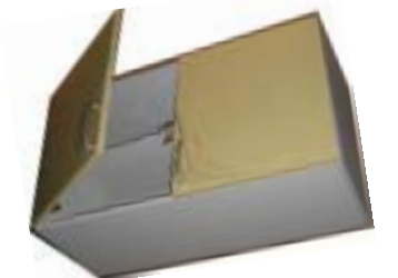
洗面室、納戸の壁にいかが? 吊り戸棚 ¥2,000